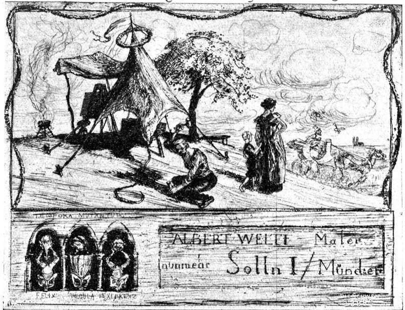
Postkartengruß des Künstlers aus Solln I bei München (Sommer 1901).