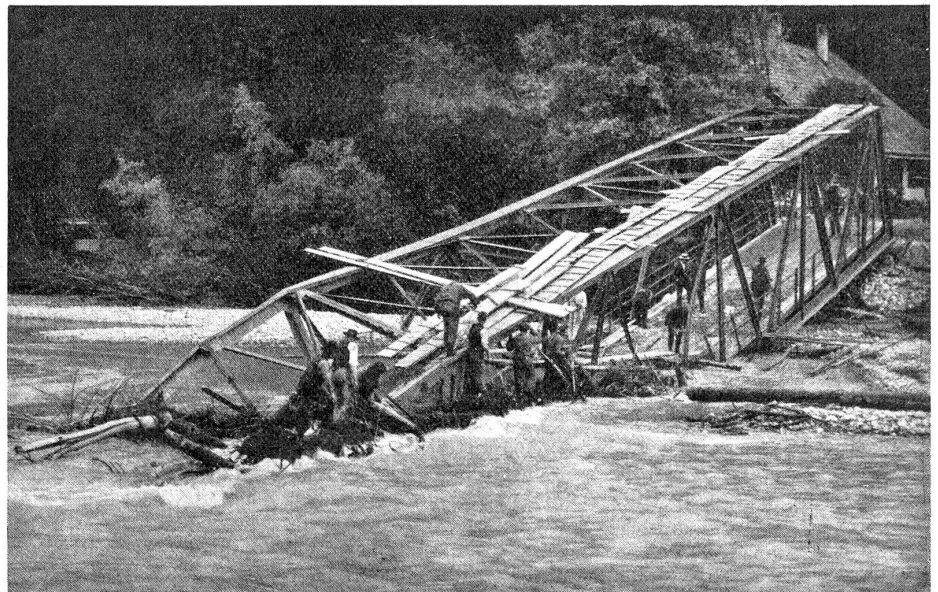
Die vom Hochwasser der Emme weggerissene Waldeggbrücke bei Burgdorf.

Der 13. und 14. Juni letzt- hin wird den Burgdorfern noch lange Zeit im Gedächtnis bleiben; denn um diese Zeit hatte die sonst so harmlose Emme wieder einmal ihre Wut. An entwurzelten Bäumen, Brettern, Telegraphenstangen usw. hatte sie noch nicht genug. Um dem Menschen so recht seine Nichtigkeit zu zeigen, riß sie gegen 2 Uhr morgens die erst vor kurzer Zeit in moderner Eisenkonstruktion erbaute Waldeggbrücke in ihre schäumenden Fluten (siehe Abbildung). Die Burgdorfer Feuerwehr, die die ganze Nacht mit dem wütenden Element schwer zu kämpfen hatte, wurde dann am folgenden Morgen durch die telegraphisch herbeigerufene Unteroffizierschule in Bern abgelöst. Während der rastlosen Arbeit am Brückendamm hatte das rasende Element noch zwei Häuser und den erst 1908 neu erbauten Scheibenstand weggerissen.