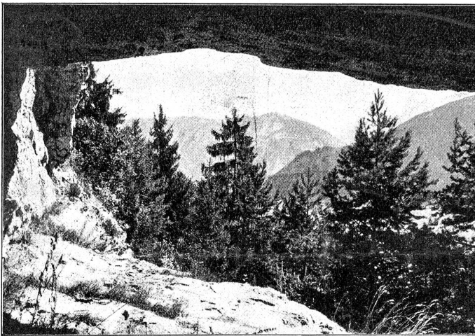
Troglodytenwohnung bei den Beatushöhlen: Das Tor gegen Osten.

Die Beatushöhlen am Thunersee, die im letzten Jahrzehnt der Bergessenheit wieder entrispen worden sind, nachdem sie