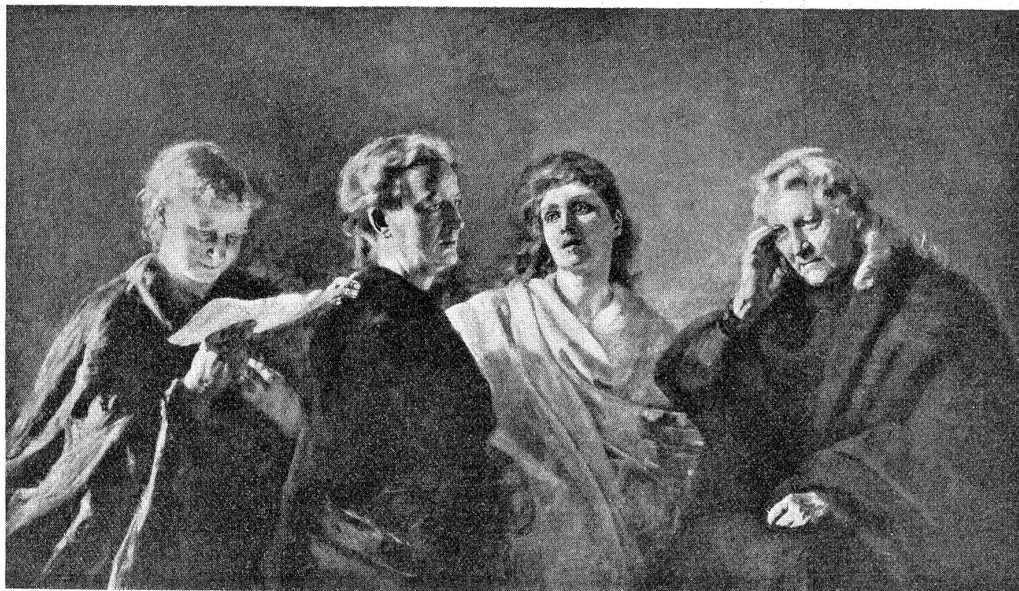
Sibyllen. Gemälde von Clara von Rappard.

In Wabern 1862 geboren, verlebte sie eine schöne Jugend an der Seite des als Naturforscher bekannten und um das Oberland hochverdienten Vaters und einer Mutter, die die Studien des Vaters und die Arbeiten der Tochter mit vollem Verständnis verfolgte. Wiederholte Reisen nach Italien, Deutschland, Paris, nach Konstantinopel und Griechenland — wovon sie im Sonntagsblatt des „Bund“ aufs Anmutigste berichtete — weckten und stärkten ihren künstlerischen Sinn.