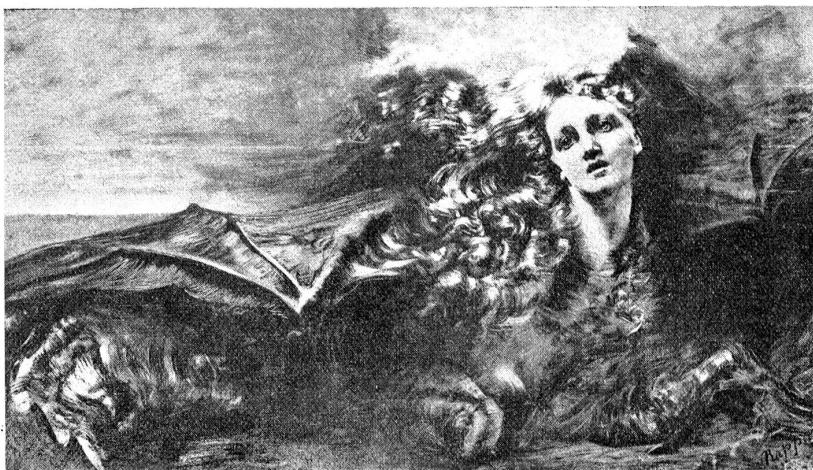
„Seele.“ Radierung von Clara von Rappard.