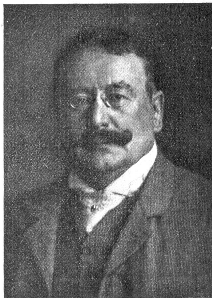
† Julius Maggi.

Hierauf begründete Herr Großrat Mühlethaler, Lehrer, mit trefflichen Worten seine Motion die Kinetographenfrage betreffend. Seine Ausführungen, die durchaus sachlich gehalten waren, entrollten ein schreckliches Bild von der Verderben bringenden Wirkung des Ringwerbes. Herr Mühlethaler hat nicht zu viel gesagt, seine Worte verdienen Dank und Anerkennung seitens der Jugendfreunde. Herr Regierungsrat Tschumi pflichtete im Allgemeinen den Ausführungen des Motionärs bei und bestätigte die durch den Ring bereits erfolgte Massenvergiftung. Er versprach die Motion nicht „schubladenreif“ werden zu lassen, er hoffe vielmehr schon im nächsten Frühjahr dem Rat eine bezügliche Gesetzesvorlage unterbreiten zu können, in der wo möglich auch die Bekämpfung der Schmutz- und Schundliteratur berücksichtigt werden soll. Ein rasches und energisches Vorgehen der Regierung in dieser Sache würde vom ganzen Berner Volk sicher warm begrüßt, denn es ist höchste Zeit, daß hierin etwas geschieht. Die