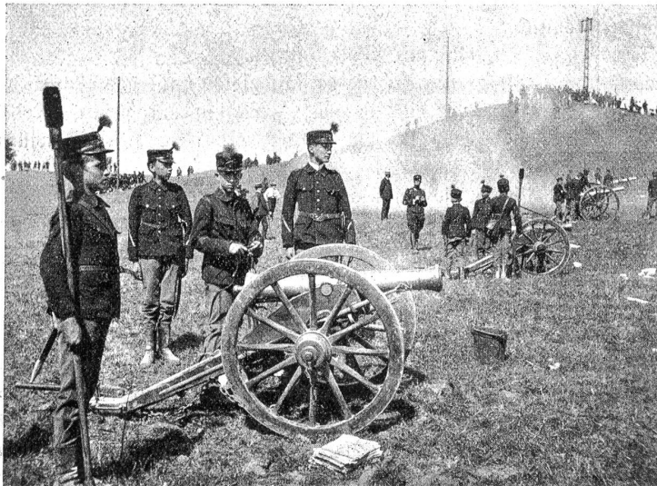
Vom Kadettenmanöver am Hauenstein: Berner Artillerie.

Wer von Berns Jungmannschaft zu den Glücklichen gehört, unserem Kadettenkorps angehören zu dürfen, wird den 11. September dieses Jahres sobald nicht vergessen.