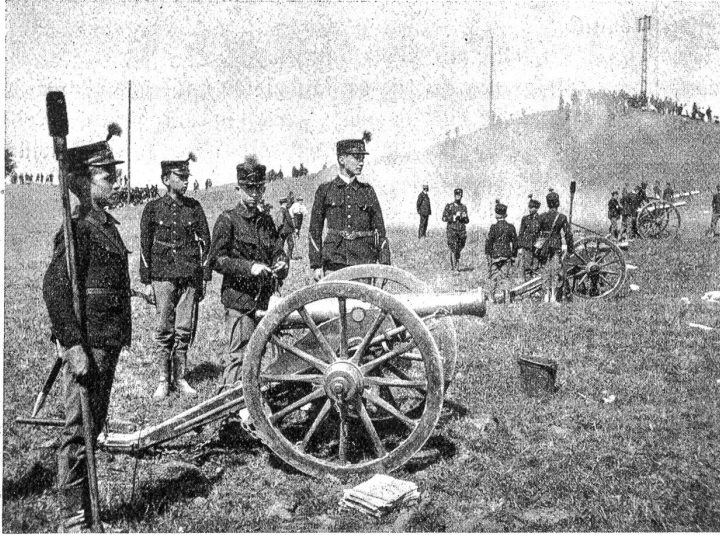
Vom Kadettenmanöver am Hauenstein: Berner Artillerie.

Wer von Berns Jungmannschaft zu den Glücklichen gehört, unserem Kadettenkorps angehören zu dürfen, wird den 11. September dieses Jahres sobald nicht vergessen.