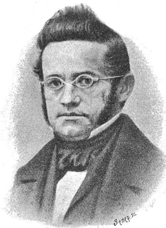
Dr. Jonas Furrer, der erste Bundespräsident.

Jonas Furrer wurde 1805 in Winterthur geboren. Er studierte Jurisprudenz in Zürich, Heidelberg und Göttingen und wirkte von 1828 bis 1845 als Rechtsanwalt in Winterthur. 1834 wurde er in den Großen Rat berufen, 1837 zum Mitglied des Erziehungsrates und 1839 zum Präsidenten der ersteren Behörde gewählt. Dann kam der „Zürichputsch“ und legte am 5. September 1839 die Regierung weg, der es an Machtmitteln fehlte. Hierbei hüßte auch Furrer alle seine Ehrenstellen ein. An die Spitze des Landes kam eine durchaus konservative Regierung. Aber im Jahre 1845 gewann der Liberalismus wieder die Oberhand und im gleichen Jahre