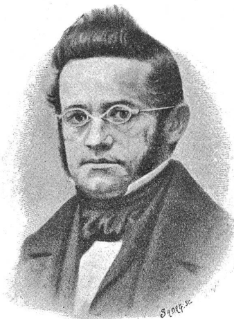
† Dr. Jonas Furrer, der erste Bundespräsident.

Jonas Furrer wurde 1805 in Winterthur geboren. Er studierte Jurisprudenz in Zürich, Heidelberg und Göttingen und wirkte von 1828 bis 1845 als Rechtsanwalt in Winterthur. 1834 wurde er in den Großen Rat berufen, 1837 zum Mitglied des Erziehungsrates und 1839 zum Präsidenten der ersteren Behörde gewählt. Dann kam der „Zürichputsch“ und legte am 5. September 1839 die Regierung weg, der es an Machtmitteln fehlte. Hierbei hüßte auch Furrer alle seine Ehrenstellen ein. An die Spitze des Landes kam eine durchaus konservative Regierung. Aber im Jahre 1845 gewann der Liberalismus wieder die Oberhand und im gleichen Jahre