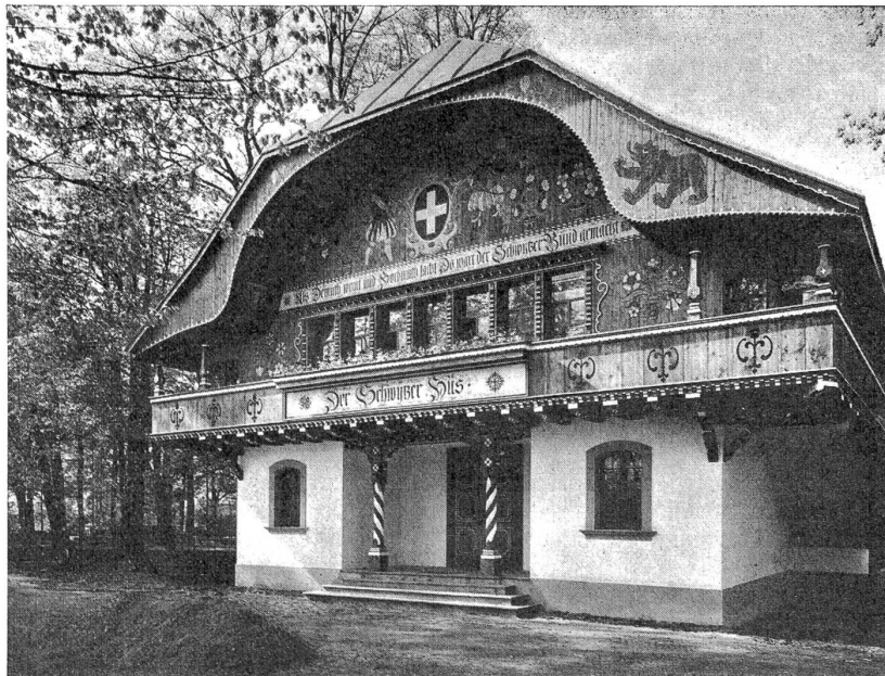
Das Schwyzerhus an der internationalen Hygiene-Ausstellung 1911 in Dresden.

Die Anerkennung, die dieser farbenreichen Architektur von Künstlern und Laien des In- und Auslandes zuteil geworden, zeigt uns, daß sich unsere alte Bernerbauart auch neben den Schöpfungen der modernsten Baukünstler ganz wohl sehen lassen kann und darf.