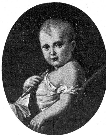
Der König von Rom.

In der Nacht des 19. März um ¾ auf 12 Uhr hatte die große Glocke der Liebfrauenkirche zu läuten begonnen. Die ganze Nacht hindurch waren die Kirchen von Paris mit einer unübersehbaren Menge betenden Volkes angefüllt. Der spannendste Augenblick kam vormittags ¾ auf 10 Uhr, als die ersten Kanonenschüsse zu ertönen begannen. Ganz Paris war von einer außergewöhnlichen Erregung ergriffen. Alles lief auf die Straße oder an die Fenster. Mit Sorgfalt wurden die Schüsse gezählt. Sobald der 22. Schuß ertönte, erscholl ein allgemeines Freudengeschrei, man umarmte sich auf den Gassen, ja, man vergoß Freudentränen. Um ½ 10 Uhr stieg Madame Blanchard in einem Militärballon in die Luft, um allen Städten und Dörfern in weitem Umkreis das frohe Ereignis kund zu