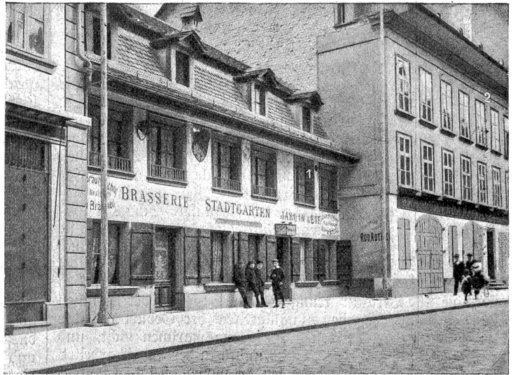
Der „Stadtgarten“ in Bern.