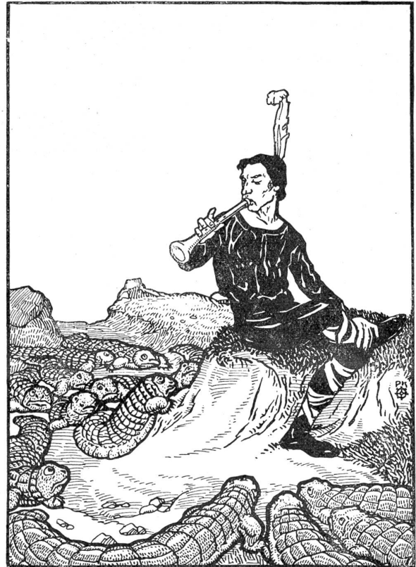
Der Zauberer und die Stollenwürmer.

Lawinsturz und nächtliche Föhnstürme verkörperte es in Geister-Dämonen. Die Kunde von diesen Gefahren, die den Alpenbewohner beständig bedrohen, hielt ja die Menschen der Ebene bis an die Schwelle des 19. Jahrhunderts im Bann; man wagte es nicht, in dieses Land der Abgründe und Gletscherschlünde hinaufzusteigen. Wie schreckhaft noch lauteten die Berichte eines Benvenuto Cellini über das Reisen in dieser Gegend; ein Haller und ein Göthe mußten zuerst schreiben, bevor der Bann gebrochen und der Fremdenstrom zu fließen begann.