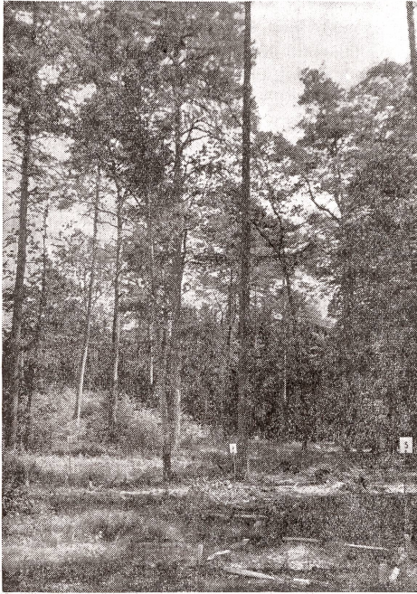
Umwandlung von Mittelwald in Hochwald durch natürliche Verjüngung im Staatswald Rheinau.

erweiterten Begriff «Schutzwald». Könnte man doch vorher mit dem Zauberstab einer Rodungsbewilligung, kaufmännisch gesprochen wertlosen Stadtwaldboden, über Nacht in glühendes Gold verwandeln. Früher war Schutzwald ausschließlich ein Wald, der Schutz bot gegen Lawinen, der im günstigsten Sinne den Stand der Gewässer beeinflusste. Schutzwald war ein Wald, der ungünstige klimatische Einwirkungen abhielt. Schutzwald war ein Wald, der schützte vor Rutschungen und Stein- oder Eisschlag.