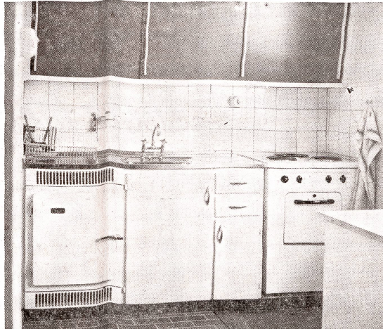
Moderne Küche einer 4 1/2-Zimmer-Wohnung am Borweg in der Siedlung der Familienheim-Genossenschaft im Friesenberg, Zürich 3. Erstellt 1959/60.