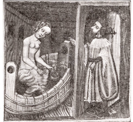
Bathseba im Bade. Frühes deutsches Beispiel für ein mittelalterliches (um 1400), heute skurril anmutendes Badezimmer. Die Holzwanne ist faßartig «konstruiert».

da diese Geldanlage in der gestützt auf die Gemeindeabstimmung vom 25. November 1917 erstellten Wohnkolonie der Vermehrung einer beschlossenen Ausgabe im Sinne von Artikel 6, Absatz 2, der Gemeindeordnung gleichkommt. Ebenso hat der Gemeinderat gemäß Artikel 32, lit. o, der Gemeindeordnung die Ausführungspläne und den Kostenvoranschlag zu genehmigen.