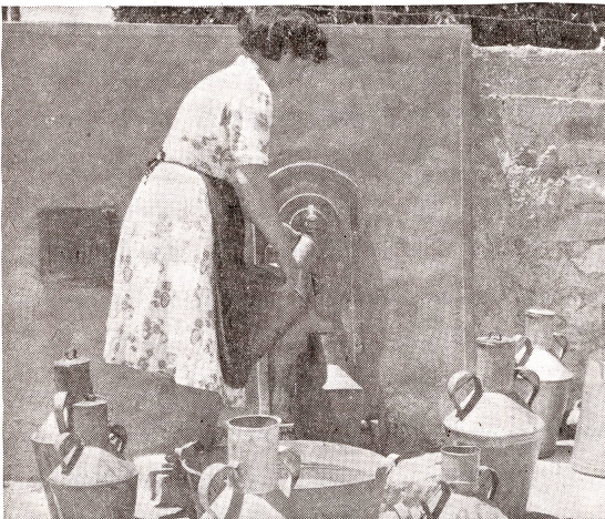
In den Wohnungen im Dorf Prizzi auf 1000 Meter Höhe in Sizilien gibt es auch heute noch keine Wasserleitungen. Die Wasser-«Verwalterin» sorgt dafür, daß jeder Einwohner das gleiche Maß Wasser bekommt.