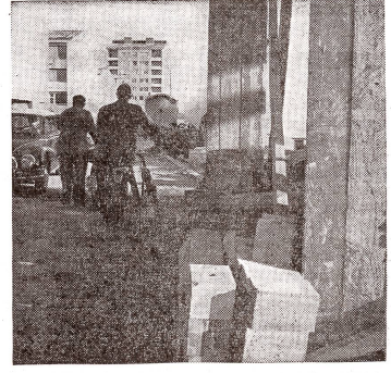
Auf dem Bauplatz der Familienheim-Genossenschaft Friesenberg Zürich-Wiedikon