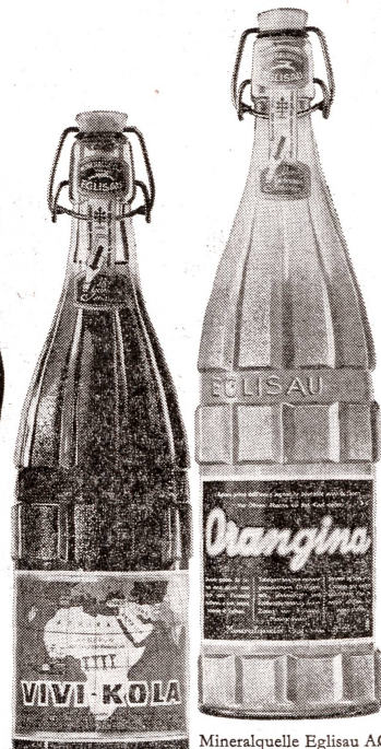
Mineralquelle Egglisau AG

ORANGINA, VIVI-KOLA und HENNIEZ erhalten Sie in jedem guten Lebensmittelgeschäft und Ihr Mineralwasser-Händler liefert Ihnen selbstverständlich auch bequem ins Haus.