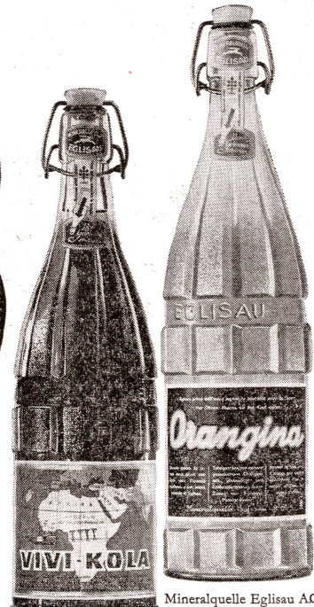
Mineralquelle Eglisau AG

ORANGINA, VIVI-KOLA und HENNIEZ erhalten Sie in jedem guten Lebensmittelgeschäft und Ihr Mineralwasserhändler liefert Ihnen selbstverständlich auch bequem ins Haus.