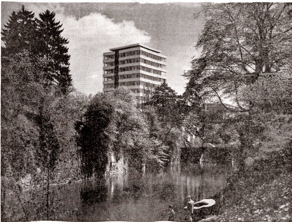
Das Hochhaus «Zur Schanze» am Schanzengraben. Bauherr: Baukonsortium «Zur Schanze», Zürich. Ausführung der Maurer- und Eisenbetonarbeiten: AG. Heinr. Hatt-Haller, Zürich.

Wer immer noch nicht davon überzeugt sein sollte, daß der Wasserlauf des Schanzengrabens nie und nimmer überdeckt, weder für Befahrungs- noch Parkzwecke verwendet werden darf, den führe man auf die Dachterrasse eines der neuen hohen Häuser in diesem Gebiet. Von oben zeigt sich das Leitbild für die weitere neuzeitliche Gestaltung dieses ungemein wertvollen Baulebensraumes noch klarer als auf den Skizzen und Modellen der diesbezüglichen Studien des Bauamtes II und der sich damit befassenden Architekten. Deutlich zeichnet sich der ideale Grüngürtel ab, der aus den hier vorhandenen Gegebenheiten heraus als Harmonie von Natur und Architektur geschaffen werden kann. Aus der Auflockerung ergeben sich herr-