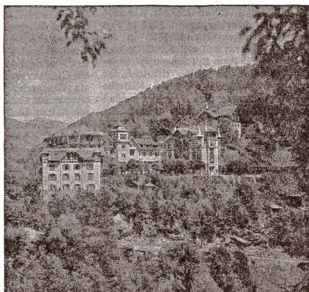
Hotel Kurhaus Bad-Passugg

Passugger Heilquellen AG, Passugg-Araschgen