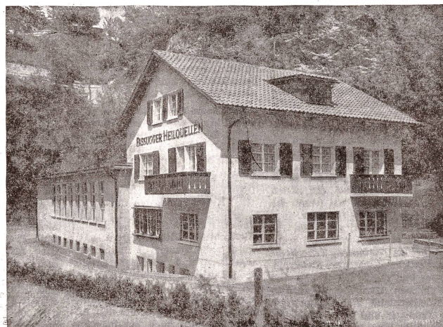
Dieses in die Landschaft eingebettete Haus steht im Dienste der Passugger Heilquellen.

Reizvoll ist die Episode, daß Sprecher , der zunächst den Betrieb leitete, Friedrich