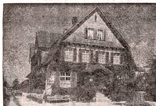
Wohnhaus und Bürogebäude