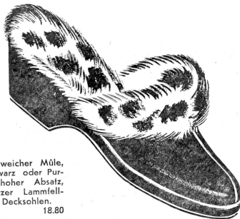
879 Besonders weicher Müle, in Sämischwarz oder Purpur; mittelhoher Absatz, weiß-schwarzer Lammfell-Kragen und Deckschlen. 18.80

WALDER: Der exklusive Schuh mit ausgezeichneter Paßform, erfolgreich und beliebt!