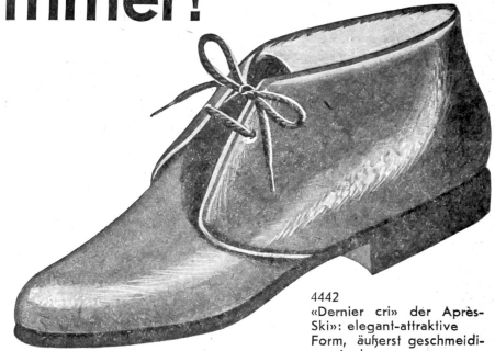
4442 «Dernier cri» der Après-Ski; elegant-attraktive Form, äußerst geschmeidiges Leder. Saffian-rot und gelb 34.80 Sämisch-schwarz 32.80

Bestechend graziös und so bequem, attraktiv und vorteilhaft! Reiche Auswahl, entzückende Farben und das beste Material erfüllen auch die Wünsche der anspruchsvollsten Dame!