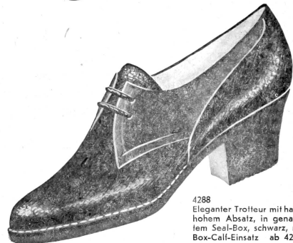
4288 Eleganter Trottleur mit halbhohem Absatz, in genarbtem Seal-Box, schwarz, mit Box-Call-Einsatz ab 42.80