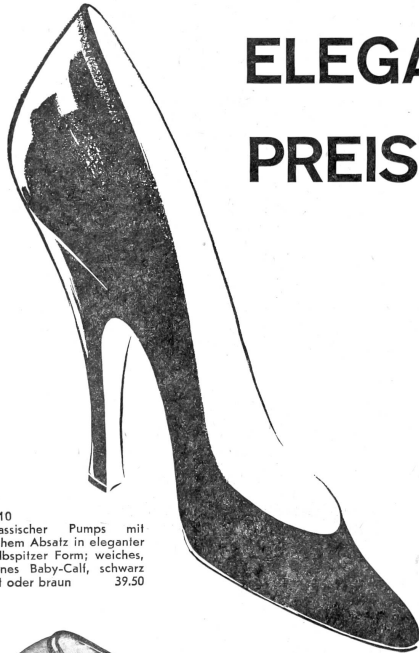
7510 Klassischer Pumps mit hohem Absatz in eleganter halbspitzer Form; weiches, feines Baby-Calf, schwarz rot oder braun 39.50

ELEGANTER denn je ... PREISWERT wie immer!