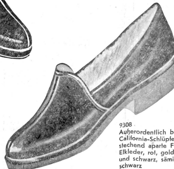
9308 Außerordentlich bequemer California-Schlüpfel, bestechend aparte Form, aus Elkleder, rot, golden, grau und schwarz, sämisch-schwarz ab 29.80