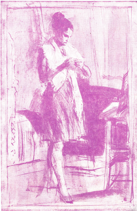
Radierung von Hans Falk