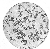
Diese Mikro-Photo zeigt in 200facher Vergrößerung scharfkantige Calcium- und Magnesium-Kristalle in einer gewöhnlichen Waschmittellösung ohne Fiberprotect.