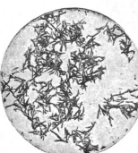
Vielleicht noch schädlicher sind diese spitzen Kristalle, die — wie Nadeln — die feinen Faserwände anstechen und aufrufen. Aufnahme durch das Mikroskop in ebenfalls 200facher Vergrößerung.