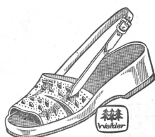
Art. C 9207 ab 19.80