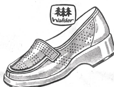
Art. C 9203 ab 26.80