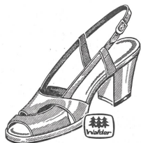
Art. B 2287 ab 32.80