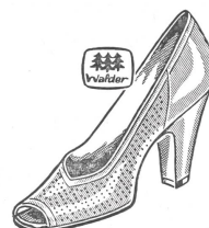
Art. 7260.1 ab 32.80