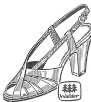
Art. 8172 ab 29.80