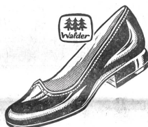
Art. 7259 ab 44.80