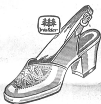
Art. B 2282 ab 27.80