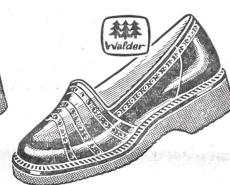
Art. 4192 ab 39.80