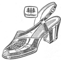
Art. B 2289 ab 29.80