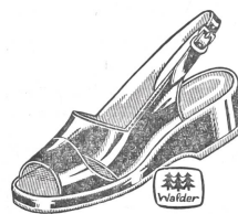
Art. C 9234 ab 16.80