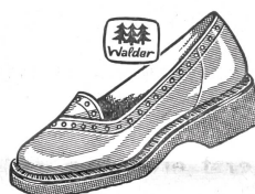
Art. 4191 ab 29.80