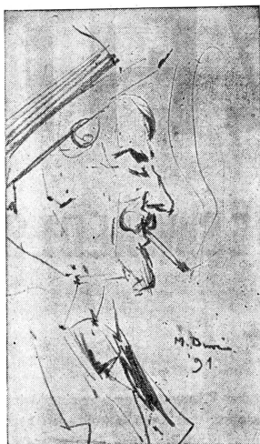
Die Cigarette · Zeichnung v. Max Buri, 1891 Berner Kunstmuseum