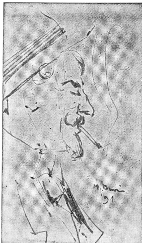
Die Cigarette · Zeichnung v. Max Buri, 1891 Berner Kunstmuseum