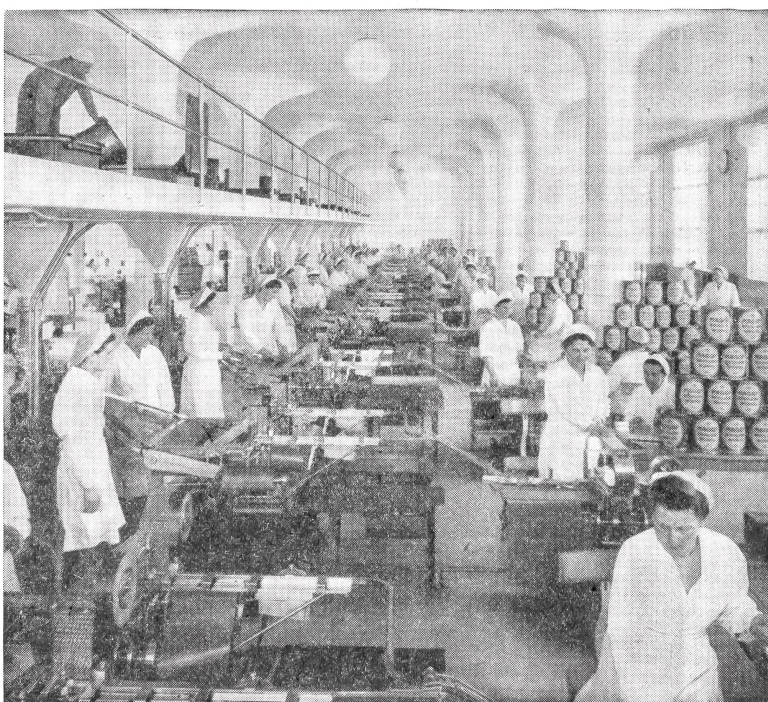
Hier werden die auf der ganzen Welt bekannten Maggi-Bouillonwürfel mit Hilfe sinnreicher Maschinen gepreßt und fein säuberlich verpackt

geszug über die Welt (in zahlreichen Staaten wird der Maggi-Bouillonwürfel in eigenen Maggi-Unternehmen hergestellt) gründet sich vor allem auf seine Qualität, die auf eine glücklich ausgewogene Verbindung von Fleischextrakt, Gemüseauszügen und anderen Zutaten zurückzuführen ist. Ueber den Wert der Bouillon für die menschliche Ernährung brauchen wir nicht viele Worte zu verlieren: schon längst haben maßgebende Aerzte erkannt, daß Bouillon auf den Körper einen wohltuenden und belebenden Einfluß ausübt. Gute Bouillon wirkt günstig ein auf die Absonderung der Magensaft und regt die Gehirn-, Herz- und Nierentätigkeit an, ohne aufzuregen. Und was wir in kranken Tagen so gern genießen, weil wir spüren, wie gut es uns tut, das ist uns in gesunden Tagen erst recht willkommen: eine Tasse herrlicher Maggi-Bouillon. Bg