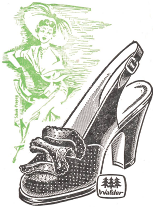
Art. B 6623

Eleganter Slingpump mit neuer Maschenverzierung. Sämischsplit schwarz oder Nubuk weiß . . . . . ab Fr. 34.80