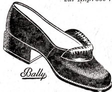
Wildleder, schwarz . . . 39.80 Kroko, braun u. schwarz 46.80

Die neuen Herbstschuhe sind eingetroffen, ich lade Sie zur Anprobe freundlich ein