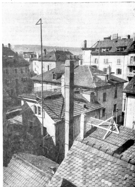
Es war einmal! Dieses Häuserkonglomerat ist verschwunden. Hier entsteht ein neues Stück Außersihl

die Kleinarzellierung und die Ueberstellung der Höfe mit vielen Werkstätten und allerlei gewerblichen Räumen erfordert eine besondere Feinfühligkeit im Vorgehen. Aber es wird trotzdem auch im Außersihl nach und nach eine gewisse städtebauliche neue Ordnung geschaffen. Und das ist gut so.