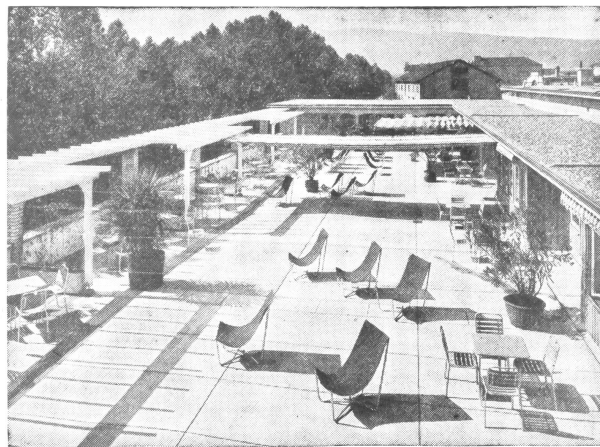
Der Dachgarten des Wohlfahrts Hauses Escher Wyß im Industriequartier in Zürich. Eine vorbildliche Hygiene, die den Architekten Landolt ebenso ehrt wie den Bauherren. Hier gibt's frische Luft in der Arbeitspause.