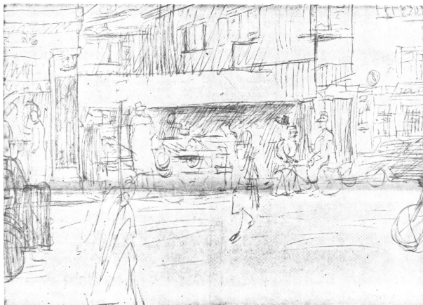
Wer kennt sie nicht, diese Situation an der Sühlfstraße, zwischen dem einstigen Schuhhaus Hirt, wo heute ein Kleidergeschäft ist, und den alten «Kripfen», die längst saniert wären, wenn nicht ein Eigentümer partout dort sterben möchte.

Inzwischen ist die Grundsteinlegung vorgenommen worden. Die verschiedenen Bauteile