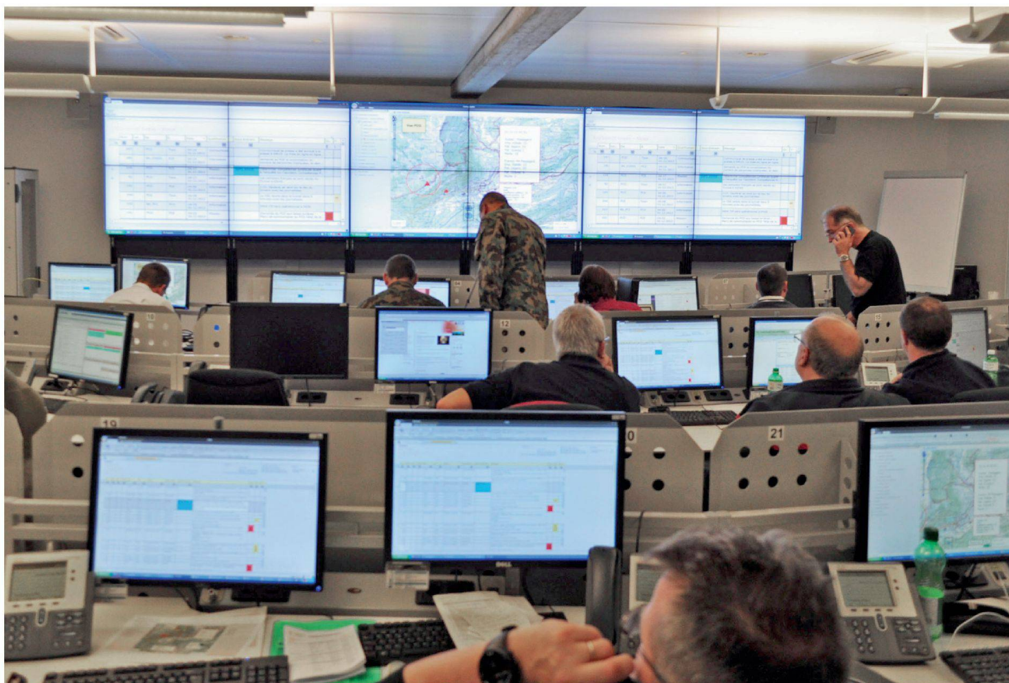
Die leistungsfähige und den Bedürfnissen angepasste Software erlaubt die strategische Führung von verschiedenen Führungsstandorten aus, wie hier dem Führungsstandort Rück.

Vorgehensweise bei Eintritt eines Ereignisses definiert; ebenfalls festgelegt sind die Aufträge der Partnerorganisationen und deren Einsatzzeitpunkt.