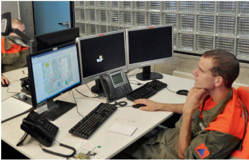
Wichtiges Kriterium: Auch Milizangehörige können mit der Software arbeiten.