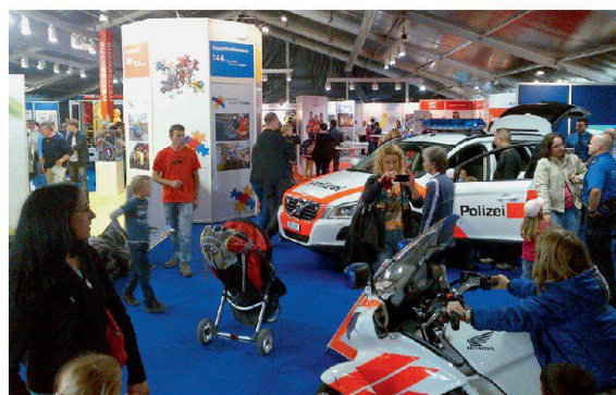
Publikumsmagnet für Jung und Alt.

lagieren und Einsatzfahrzeuge besichtigen. Videos und gestellte Szenen aus der Arbeit der Einsatzkräfte belebten den Auftritt im über 600 Quadratmeter grossen Zelt. Auf dem Aussengelände fanden während drei Tagen eindrucksvolle Live-Demonstrationen statt: Brandereignis mit Rettungen, Strassenrettung mit und ohne Fahrzeugbrand, Öl- und Chemiewehreinsatz, Trümmerrettungen und schliesslich ein Platzkonzert des Spiels der Kantonspolizei Thurgau.