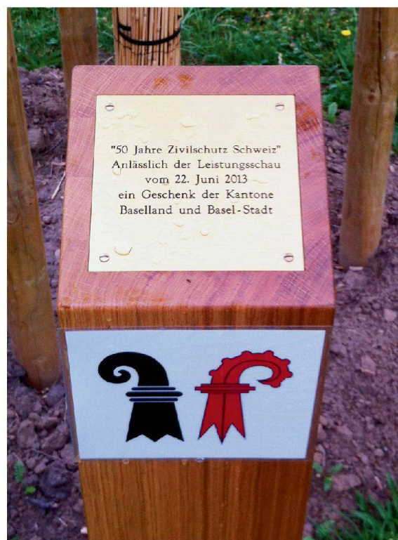
Zur Feier des 50-Jahr-Jubiläums des Schweizer Zivilschutzes wurden 2013 in der ganzen Schweiz Bäume gepflanzt.

Um die gemeinsame Arbeit zum Schutz der Bevölkerung zu betonen, pflanzten die Herren Regierungsräte Dürr und Reber einen Baum. «Ein Symbol für die wachsende Zusammenarbeit», sagte Reber, «und für die Nachhaltigkeit des Zivilschutzes, der fest verwurzelt ist in unserer Gesellschaft.»