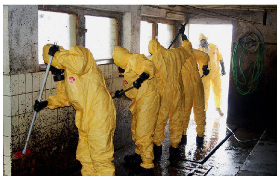
Reinigung und Desinfizierung der Ställe.