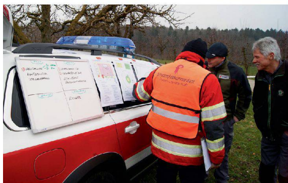
Absprachen zwischen Schadenplatzkommandant, Veterinär und Hofbesitzer.

Über eine Woche übten der Kantonale Krisenstab, zwei Regionale Krisenstäbe, die ABC-Wehr Baselland, drei Zivilschutzkompanien und eine Veterinärkompanie der Armee die Bekämpfung der hoch ansteckenden Maul- und Klauenseuche im Oberbaselbiet. Auf drei landwirtschaftlichen Betrieben mit Kühen wurden die Ställe komplett geleert, entseucht, desinfiziert und damit «entgiftet».