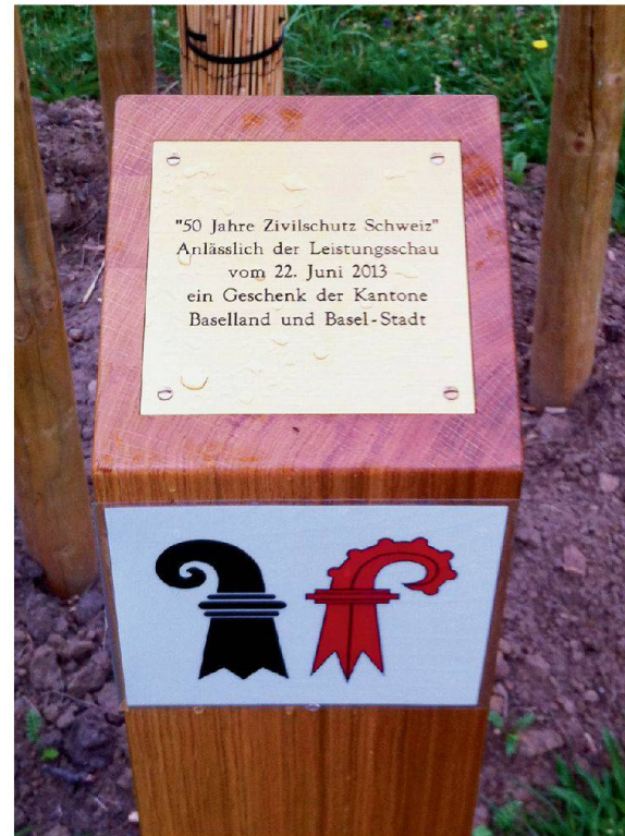
Zur Feier des 50-Jahr-Jubiläums des Schweizer Zivilschutzes wurden 2013 in der ganzen Schweiz Bäume gepflanzt.

Um die gemeinsame Arbeit zum Schutz der Bevölkerung zu betonen, pflanzten die Herren Regierungsräte Dürr und Reber einen Baum. «Ein Symbol für die wachsende Zusammenarbeit», sagte Reber, «und für die Nachhaltigkeit des Zivilschutzes, der fest verwurzelt ist in unserer Gesellschaft.»