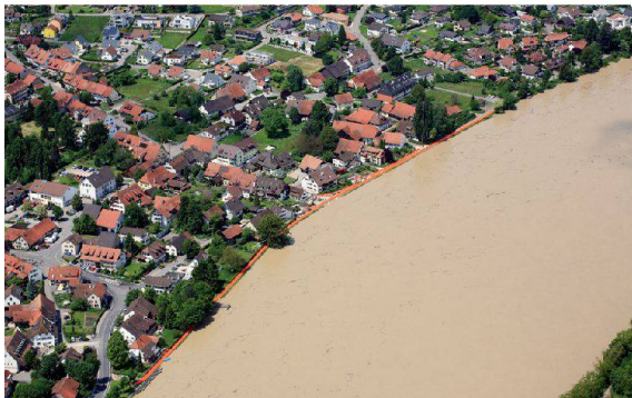
Der rettende orange Schutzwall in Wallbach.

Aufgrund der erhöhten Hochwassergefahr im Aargau beschloss der kantonale Führungsstab am 31. Mai 2013, an mehreren Orten mobile Hochwassersperren einzubauen. Neben den Blaublicht- wurden auch Zivilschutzorganisationen aufgeboden; das Kantonale Katastrophen Einsatzelement (KKE) stand in Brugg im Einsatz.