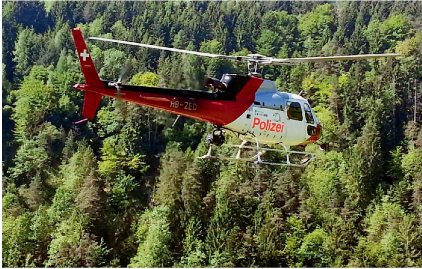
Wasserbauspezialisten verschaffen sich Anfang Juni 2013 an Bord eines Polizei-Helikopters ein Gesamtbild der Überschwemmungen im Rheintal.

den Zusatzangaben der Kraftwerksbetreiber. Zugleich ist das Warn- und Alarmierungswesen vor Ort eigenständig organisiert. «Das Rheinunternehmen ist mit uns in ständigem Kontakt und spricht sich unmittelbar mit den Feuerwehrkommandos der Gemeinden ab», sagt der St. Galler Stabschef Fritsche. Die an die Rheinufer angrenzenden Grundeigentümer, darunter grosse Gewerbebetriebe und Landwirte, werden ebenfalls direkt kontaktiert. Zu evakuieren waren zwar weder Menschen noch Tiere. Aber die regionalen Führungsorgane boten Baufirmen auf, um Dämme mit schwerem Gerät zu verstärken oder Bagger zum Räumen von Bachläufen bereitzustellen. Die Feuerwehrleute konnten sich derweil auf Strassen- und Brückensperren konzentrieren sowie Überwachungs- und Kontrollaufgaben übernehmen. «Das funktioniert im Normalfall so gut, dass wir selbst kaum eingreifen müssen», ergänzt Frauenfelder. Einzig als das Personal knapp