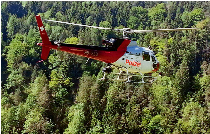
Wasserbauspezialisten verschaffen sich Anfang Juni 2013 an Bord eines Polizei-Helikopters ein Gesamtbild der Überschwemmungen im Rheintal.

den Zusatzangaben der Kraftwerksbetreiber. Zugleich ist das Warn- und Alarmierungswesen vor Ort eigenständig organisiert. «Das Rheinunternehmen ist mit uns in ständigem Kontakt und spricht sich unmittelbar mit den Feuerwehrkommandos der Gemeinden ab», sagt der St. Galler Stabschef Fritsche. Die an die Rheinufer angrenzenden Grundeigentümer, darunter grosse Gewerbebetriebe und Landwirte, werden ebenfalls direkt kontaktiert. Zu evakuieren waren zwar weder Menschen noch Tiere. Aber die regionalen Führungsorgane boten Baufirmen auf, um Dämme mit schwerem Gerät zu verstärken oder Bagger zum Räumen von Bachläufen bereitzustellen. Die Feuerwehrleute konnten sich derweil auf Strassen- und Brückensperren konzentrieren sowie Überwachungs- und Kontrollaufgaben übernehmen. «Das funktioniert im Normalfall so gut, dass wir selbst kaum eingreifen müssen», ergänzt Frauenfelder. Einzig als das Personal knapp