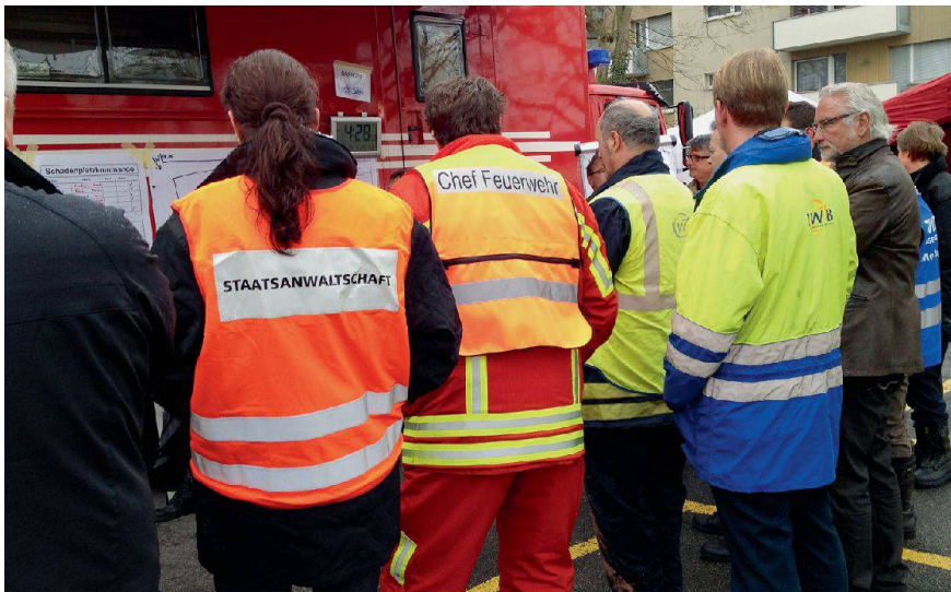
Schadenplatzkommando nach der Explosion von Pratteln BL 2012: Die technischen Betriebe sind auch hier präsent.

sorger – wie andere Unternehmen – bereits als Gäste oder Partner an den Rapporten dabei, auch an Übungen mit entsprechenden Szenarien.