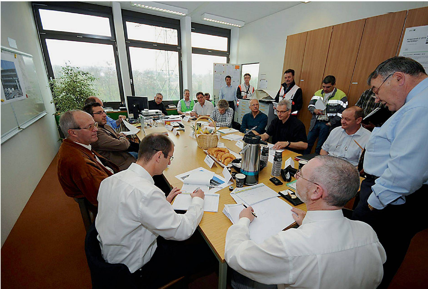
Einsatzübung INFERNO des Baselbieter Kantonalen Krisenstabes (KKS) mit Elektra Birseck, Münchenstein (EBM). Am Tisch die Verantwortlichen der EBM beim Rapport, stehend eine Verbindungsperson zum KKS.