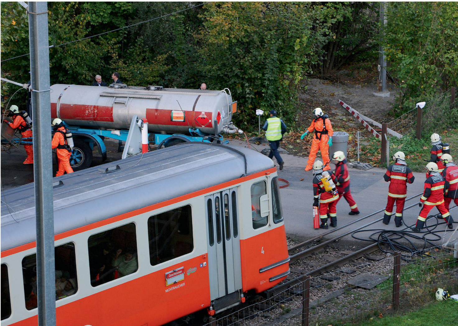
Bei Katastrophen sind häufig auch die technischen Betriebe betroffen, beispielsweise wenn Verkehrswege unterbrochen sind. Im Bild: Szene aus der Übung Ferrovia 2010 im Kanton Aargau.

Im Katastrophenfall können Stromausfälle, Probleme mit der Trinkwasserversorgung oder unterbrochene Telekommunikationsverbindungen die betroffene Bevölkerung zusätzlich belasten und die Rettungsarbeiten erschweren. Deshalb ist es wichtig, dass die technischen Betriebe ihre Rolle als Partnerorganisation im Bevölkerungsschutz konsequent einnehmen.