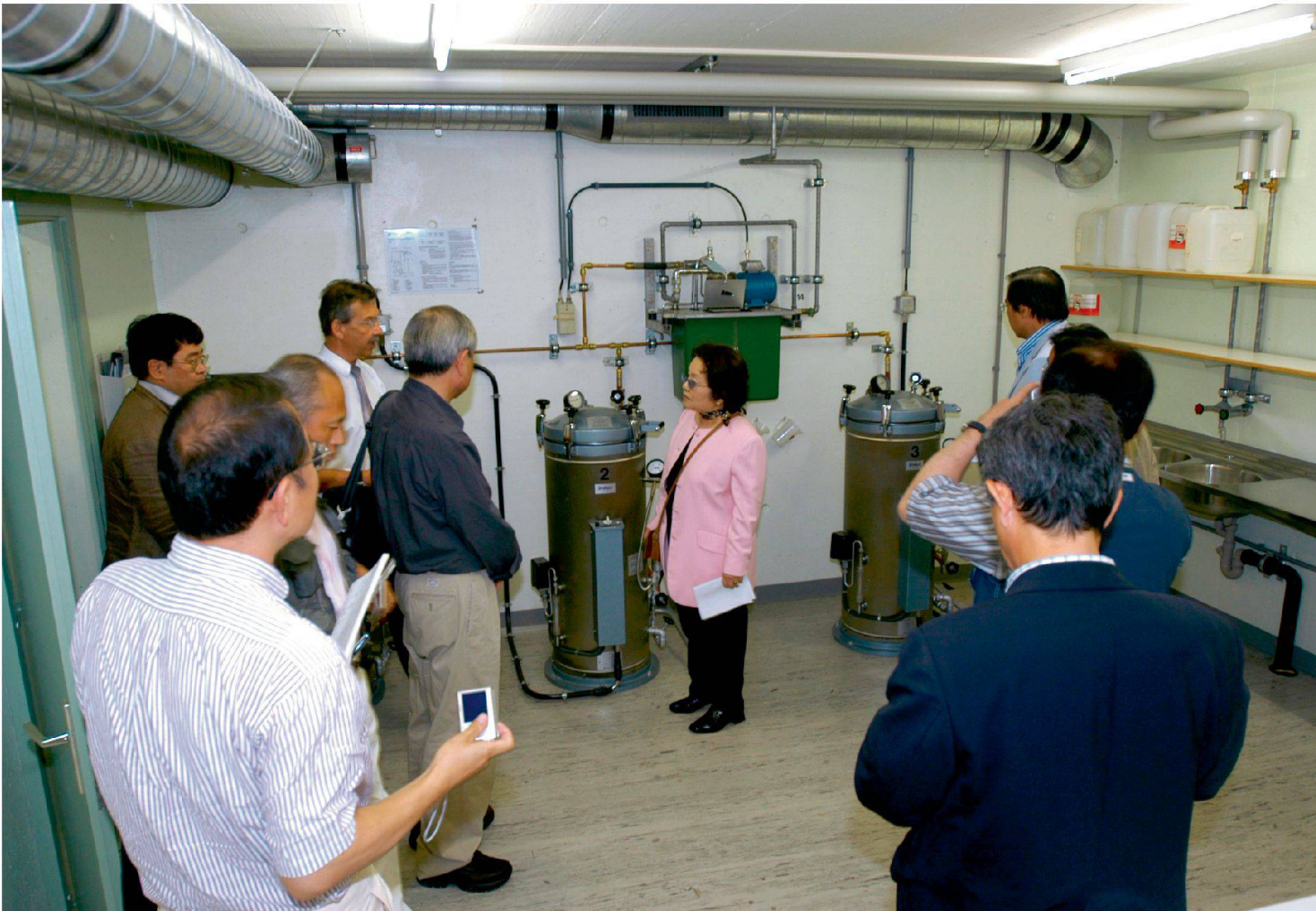
Das Interesse im Ausland an der Schweizer Schutzinfrastruktur besteht bis heute bestehen, insbesondere in sicherheitspolitisch heiklen Regionen. Im Bild: Delegation aus Ostasien (2004).

Bau eines eigenen Schutzraumes befassten, vor allem aber Ingenieure und Unternehmer, die ins Schutzbaugeschäft einsteigen wollten. Die Verschärfung des Kalten Krieges nach dem sowjetischen Einmarsch in Afghanistan Ende 1979 bewirkte ein steigendes Interesse an den Schutzbauten. Nahezu tausend Anfragen über organisatorische und vor allem bauliche Aspekte des Zivilschutzes gelangten ans BZS. In den meisten Fällen waren Unterlagen über den baulichen Zivildschutz gewünscht. Das BZS organisierte und moderierte mit dem Schweizerischen Zivildschutzverband auch internationale Fachtagungen und Konferenzen. Für die Schweizer Exportwirtschaft wurde der bauliche Zivildschutz zu einem wichtigen Faktor.