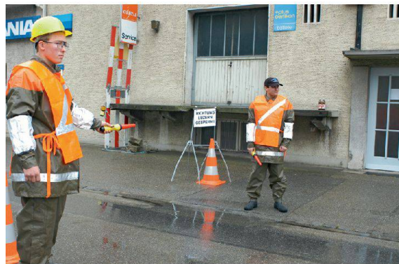
Der Zivilschutz unterstützt die Polizei etwa bei Absperrungen.

Auch die immer rascher voranschreitende Entwicklung in Technik und Informatik zwingt die Polizeikorps zu einer engeren Kooperation, um die knappen finanziellen Mittel weiterhin wirtschaftlich einsetzen zu können. Damit das föderalistisch aufgebaute Polizeiwesen, das der Schweiz eine auf die Bevölkerung orientierte Sicherheitsarbeit garantiert, erhalten werden kann, braucht es somit mehr Kooperation. Als wichtige Partner des Sicherheitsverbundes Schweiz nimmt die Polizei diese Entwicklungen ernst. Bürgernahe Polizeiarbeit und ein eingespieltes Zusammenwirken aller Polizeikorps untereinander und mit allen Sicherheitspartnern sind unsere Erfolgsfaktoren.