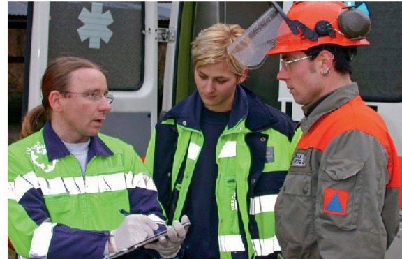
Einige Kantone verfügen für den Katastrophenfall über sanitätsdienstliche Elemente des Zivilschutzes.

Der Zivilschutz hat aus der Sicht des Gesundheitswesens eher eine marginale Funktion. Im weiteren Sinne kann er für das Gesundheitswesen aber eine ideale Unterstützung sein (Betreuung Obdachloser, Betrieb Hotline usw.). Wichtig erachte ich die personelle Unterstützung des Bundesamtes für Bevölkerungsschutz BABS beim Anlegen von Übungen (Stabsübungen, SEISMO usw.) für das Gesundheitswesen. Diese Unterstützung wird aber viel zu wenig genutzt. Besonders zu erwähnen sind die sanitätsdienstlichen Elemente des Zivilschutzes, die in einigen wenigen Kantonen mit der Reform Bevölkerungsschutz zum Glück nicht aufgehoben worden sind, und die bei lang andauernden Ereignissen das Gesundheitswesen unterstützen können (Stichwort Durchhaltefähigkeit).