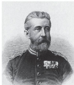
Friedrich von Esmarch kümmerte sich um die Erste-Hilfe-Ausrüstung der Soldaten.

Nach dem Tod seiner ersten Frau heiratete Esmarch Prinzessin Henriette von Schleswig-Holstein. 1887 wurde er für seine Verdienste geadelt. Seine späte Arbeitsphase war überschattet von privaten und fachlichen Auseinandersetzungen, die seinem öffentlichen Ansehen schaden. Er starb 1908 in Kiel.