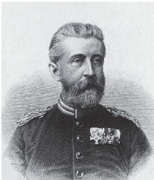
Friedrich von Esmarch kümmerte sich um die Erste-Hilfe-Ausrüstung der Soldaten.

Nach dem Tod seiner ersten Frau heiratete Esmarch Prinzessin Henriette von Schleswig-Holstein. 1887 wurde er für seine Verdienste geadelt. Seine späte Arbeitsphase war überschattet von privaten und fachlichen Auseinandersetzungen, die seinem öffentlichen Ansehen schaden. Er starb 1908 in Kiel.