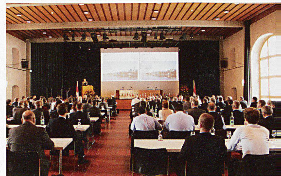
Rund 150 hochrangige Verantwortliche und Fachleute nahmen an der Bevölkerungsschutzkonferenz in Solothurn teil.