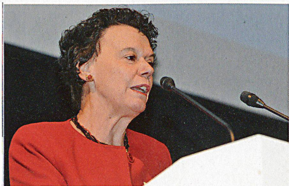
Regierungsrätin Esther Gassler, Vorsteherin des Volkswirtschaftsdepartements des Kantons Solothurn.

Unter der Bezeichnung SEISMO 12 findet im Mai 2012 eine international angelegte Übung zur Bewältigung eines schweren Erdbebens statt. Als Vorbereitung darauf lud das Bundesamt für Bevölkerungsschutz BABS die beübten Organisationen zu einem Seminar mit hochkarätigen Referentinnen und Referenten ein.