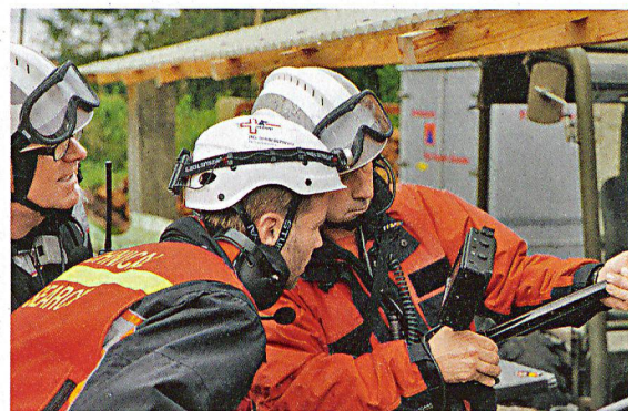
Die Teleskop-Kamera liefert den Rettern wichtige Informationen über die Lage eines Verschütteten. Sie ermöglicht überdies eine Sprechverbindung.