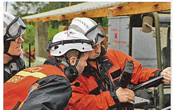
Die Teleskop-Kamera liefert den Rettern wichtige Informationen über die Lage eines Verschütteten. Sie ermöglicht überdies eine Sprechverbindung.