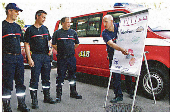
Viele Ausbilder konzentrieren sich bei der Lektionsvorbereitung fast nur auf den Inhalt ihrer Lektionen. Körpersprache und Stimme sollten aber ebenso beachtet werden.

Alle Kader stehen von Zeit zu Zeit vor einem erwartungsvollen Publikum, müssen Ideen und Produkte präsentieren oder Mitarbeitende aus- und weiterbilden. Sofort stellen sich Fragen: Wie transportiere ich meine Botschaften nachhaltig und interessant? Wie wirke ich? Welche (Hilfs-)Mittel verwende ich? Der Didaktik-Methodik-Kurs des Schweizerischen Feuerwehrverbandes SFV gibt konkrete Antworten und bietet viele Trainingsmöglichkeiten an.