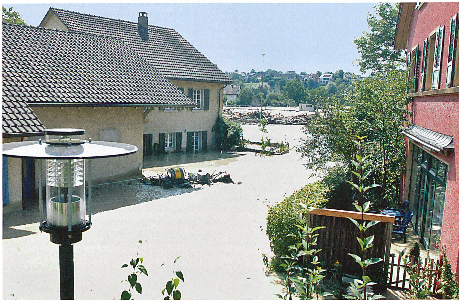
Nach den Hochwassern von 2005 wurde angestrebt, ein einheitliches Warnsystem zu etablieren, um für die Bevölkerung eine präzise Unwetterwarnung, insbesondere bei Hochwassern und Stürmen zu gewährleisten.

ren Bild der aktuellen Situation und zu Unsicherheit über das richtige Verhalten führen. Im Nachgang zu den Hochwassern 2005 kam deshalb auch in den eidgenössischen Räten die Forderung auf, ein einheitliches Warnsystem zu etablieren, das «eine präzise Unwetterwarnung der Bevölkerung, insbesondere bei Hochwassern und Stürmen» gewährleistet.