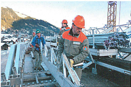
Die Obergrenze bei Gemeinschaftseinsätzen soll für den einzelnen Schutzdienstpflichtigen bei drei Wochen pro Jahr liegen.

Gegenüber der Vernehmlassungsvorlage sind auf Wunsch der Kantone einzelne Bestimmungen angepasst worden: So war vorgesehen, dass künftig nur noch Schutzräume mit einer Mindestgrösse von 51 Schutzplätzen gebaut werden. Dies hätte bedeutet, dass nur bei Wohnhäusern und Überbauungen ab 77