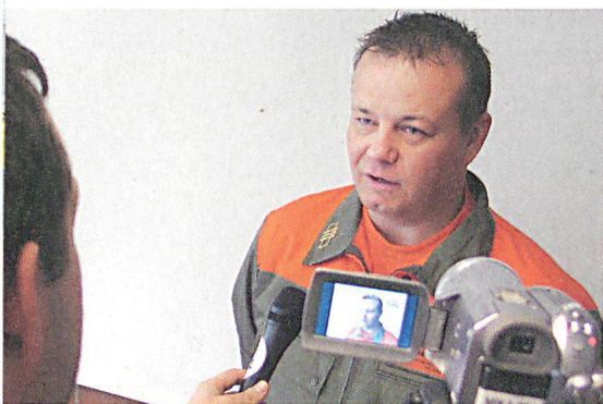
Ein Zivilschutzkommandant beim Trainings-Interview.

Medienarbeit ist auch im Zivilschutz eine Daueraufgabe. Kommunizieren dient nicht nur der Imagepflege, sondern ist ein wichtiges Führungsmittel. 37 Kommandanten und ihre Stellvertreter aus über 20 St. Galler und Appenzeller Zivilschutzorganisationen frischten am 22./23. April 2010 in Mels ihr Können auf. Unterstützt wurden sie von Profis des Bundesamtes für Bevölkerungsschutz BABS und der Armee.