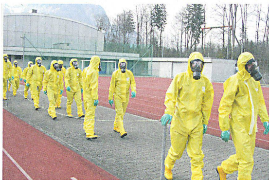
Für den Fall von ABC-Ereignissen stehen in der Kantonalen Zivilschutzformation ABC-Spezialisten zur Verfügung.

Die Zivilschutzformation des Kantons Bern besteht aus der Führungsunterstützung, den ABC-Spezialisten und der Unterstützung. Dazu zählen eine Geschäftsstelle, ein Kommando und rund 210 Angehörige des Zivilschutzes. Sämtliche Elemente können durch das Kantonale Führungsorgan (KFO) zugunsten der Regionen und Gemeinden eingesetzt werden.