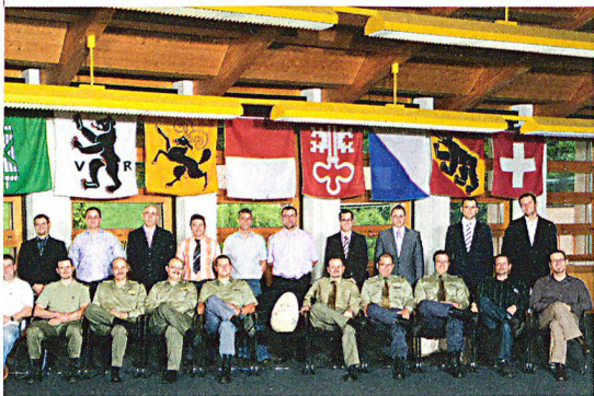
Die 20 Diplomierten im Eidgenössischen Ausbildungszentrum in Schwarzenburg (EAZS).

Der Zivilschutz verfügt über eine Reihe neuer Lehrpersonen: Das Bundesamt für Bevölkerungsschutz BABS hat am 18. Juni 2010 in Schwarzenburg sechzehn haupt- und vier nebenamtlichen Zivilschutzinstruktoren die verdienten Diplome verliehen.