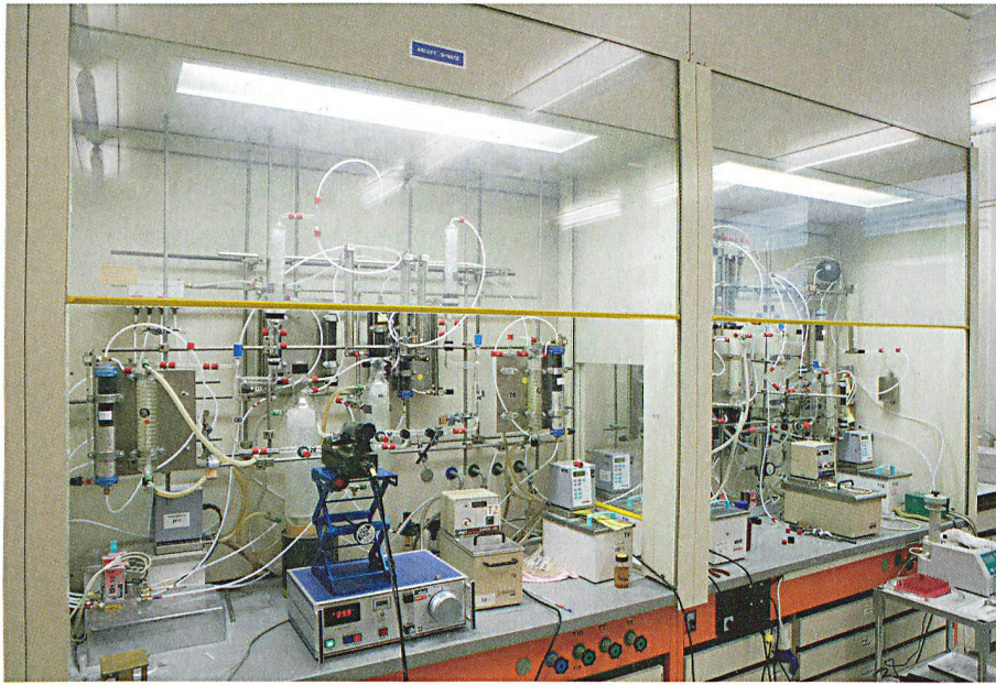
Im LABOR SPIEZ kann das gesamte Spektrum der technischen Aspekte des ABC-Schutzes bearbeitet werden.

Seit Mai 2010 sind die physikalischen und chemischen Laboratorien des BBK in die Liegenschaft des Bestückungslagers in Bonn-Dransdorf umgezogen. Dies wurde verbunden mit einer