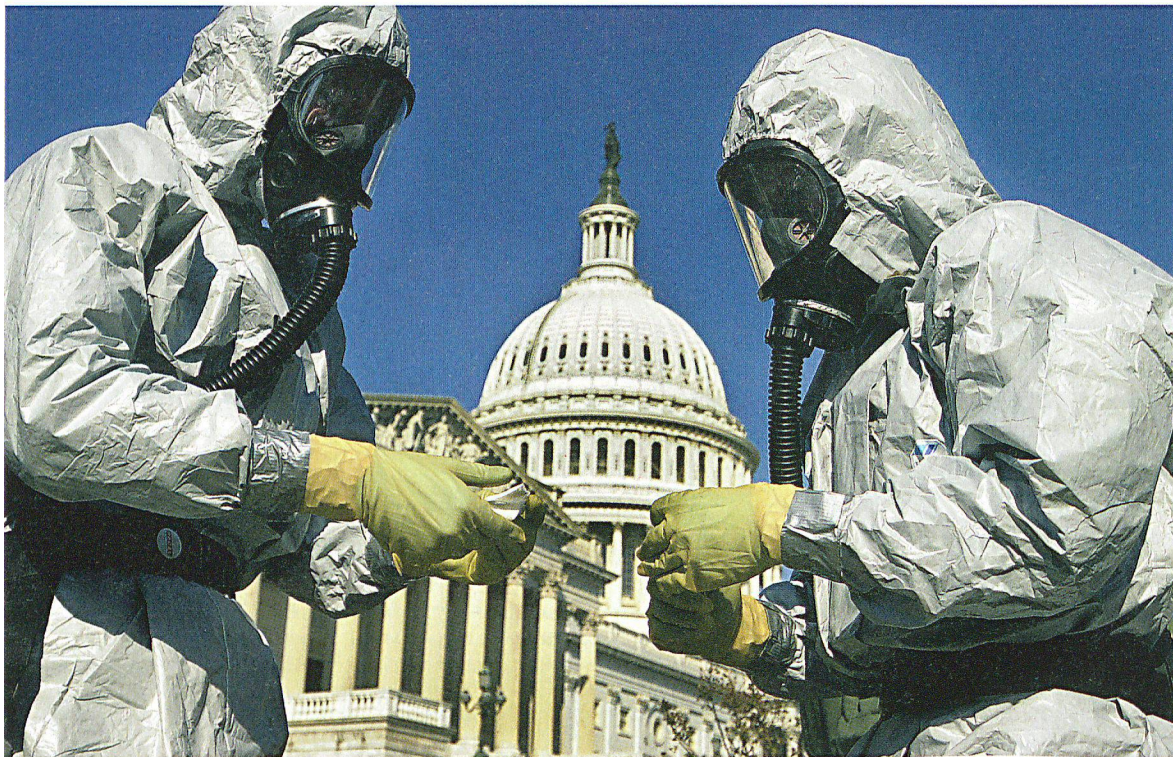
Die 2001 in den USA verschickten Anthrax-Briefe haben gezeigt, wie B-Waffen Angst und Panik in der Bevölkerung auslösen können.

Die Anthrax-Anschläge von 2001 in den USA, aber auch der SARS-Ausbruch 2003 oder die jüngsten Influenzapandemiebedrohungen bestätigten, dass jederzeit auch in der Schweiz mit grösseren biologischen Bedrohungen gerechnet werden muss. Eine wichtige Voraussetzung für die Verringerung der Gefährdung ist ein gut ausgebautes Netz von Analyselabors.