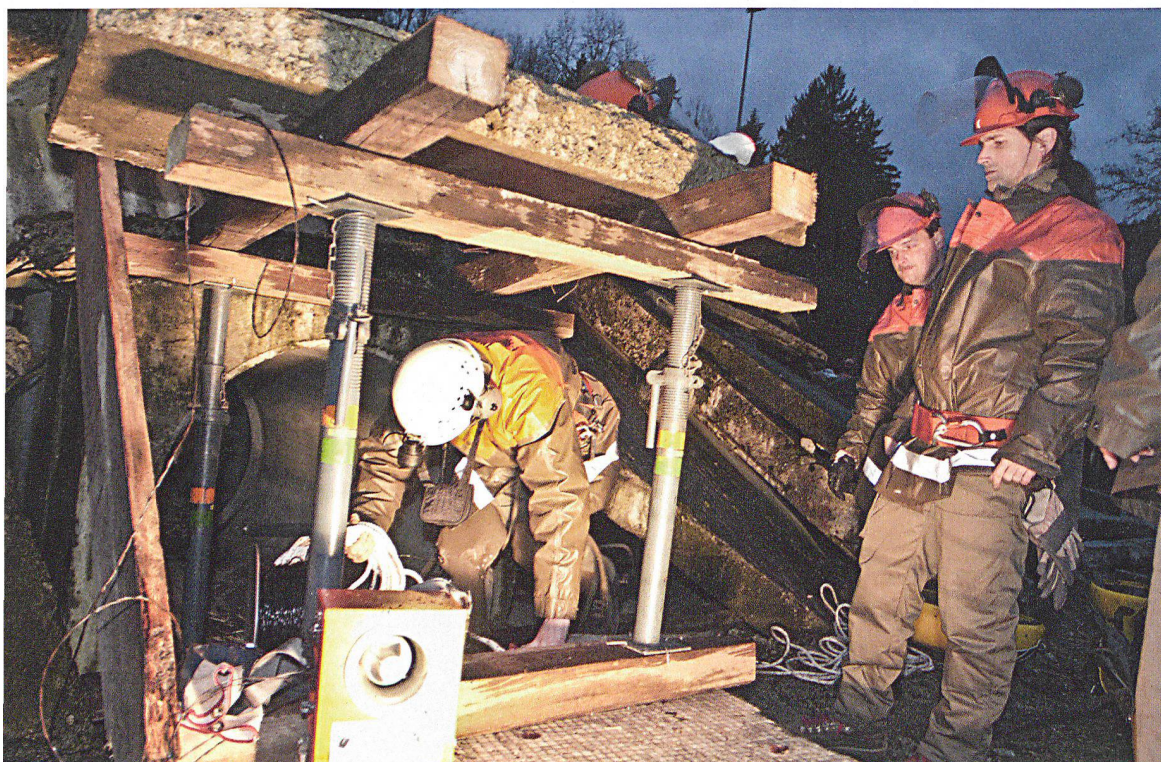
Erdbebenbewältigung in der Schweiz: für die Einsatzkräfte ein realistisches Szenario.