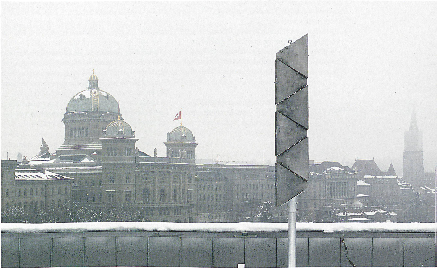
In der ganzen Schweiz verteilt stehen derzeit etwa 4700 stationäre Sirenen für die Alarmierung der Bevölkerung mit dem Allgemeinen Alarm.