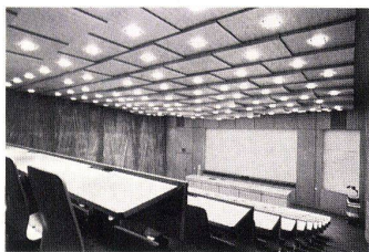
ETH-Zürich Vermipan-Decke, edelfurniert

Die verschiedenen Großbrände und Brandkatastrophen der letzten Jahrzehnte riefen zwangsläufig nach konkreteren und auch schärferen baulichen Brandverhütungsvorschriften. So werden zum Beispiel nach den Brandverhütungsvorschriften der Vereinigung kantonaler Feuerversicherungsanstalten vom Februar 1974 in Fluchtwegen von Bürobauteilen, Schulhäusern, Kasernen und Industriebauten keine brennbaren Baustoffe für raumseitige Verkleidungen zugelassen. Das heißt, es dürfen nur unbrennbare Baustoffe der Brandklasse VI eingesetzt werden, was einen Ausbau mit Holz- und Holzwerkstoffen zum vornherein ausschließt. Diese scharfen Vorschriften dienen der Sicherheit des Menschen, beeinträchtigen aber andererseits die Gestaltungsmöglichkeiten des Architekten und des Bauherrn sehr negativ. Zusätzlich schränken sie das Arbeitsgebiet des holzverarbeitenden Innenausbauers ein. Dieses Problem wurde von der Firma Novopan AG erkannt und so schufen die Labors dieser