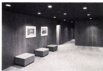
Hotel Zürich Unbrennbare edelfurnierte Vermipan-Täferwände

Genre Otis AG, die Schweizer Herstellerfirma mit internationalem Background (und Know-how), sorgte zusätzlich dafür, daß die Aufzüge stets gleichmäßig über alle Stockwerke verteilt sind. Dafür dient eine spezielle Automatik. Ein Beispiel: wenn drei Gäste zur gleichen Zeit mit drei Aufzügen ins Erdgeschoß fahren, dann bleiben die Aufzüge nicht einfach dort stehen. Einer fährt sofort wieder ins ober-