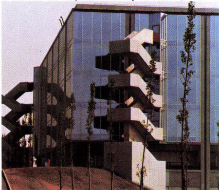
IBM Italia, Milano-Segrate, Italien, 1975 INFRASTOP-Auresin 39/28 Arch. Zanuso, Mailand

tisierten Gebäuden im Sommer entscheidend verringert werden und echte Energie-Einsparung bewirken.