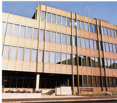
Siemens-Albis AG, Zürich, Schweiz, 1976 INFRASTOP-Auresin 39/28 Generalunternehmung Göhner AG, Zürich

Dank hoher Energie-Rückstrahlung werden je nach Typ 56% bis 85% der anfallenden Sonnenenergie zurückgestrahlt, so dass die erforderlichen Kühllasten bei vollklima-